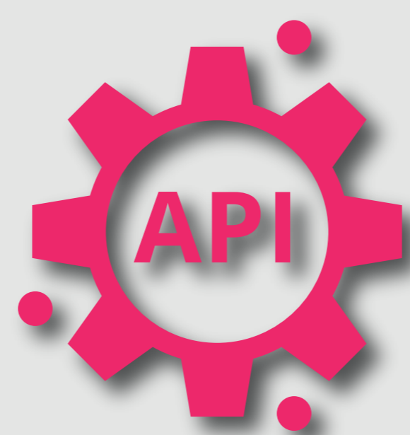
Integración simple y flexible