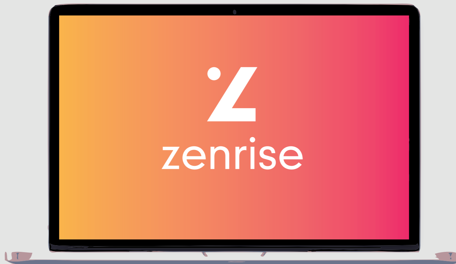
Plataforma de gestión de cobranzas con medios de pago integrados