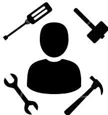
Prestadores de servicios