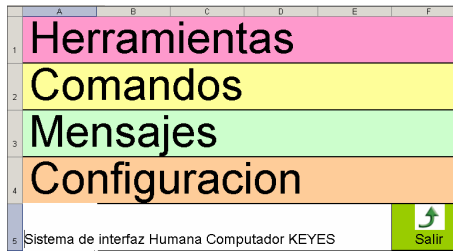
fig.2 Menu principal

Durante la segunda mitad del año 2006 se inicio la construcción en lenguaje Java de los programas que constituyera la nueva interface de software para Keyes. En el diseño se definió una jerarquía de menús con una configuración de colores con alto contraste que permita visualizar claramente la posición del puntero y las letras contenidas en ellos. La jerarquía de menú, contempla tres niveles, el primero es mostrado en la figura 2, en herramientas el usuario podrá elegir entre las opciones Calculadora, Procesador de texto y juegos. En estas y en las demás opciones, cuando necesite escribir texto el programa llamará al tablero de la figura 3, para crear el texto.