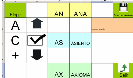
fig. 3 Tablero para escribir los mensajes

El tablero tiene comandos como en los ángulos derecho, superior e inferior para guardar el mensaje construido y salir respectivamente.